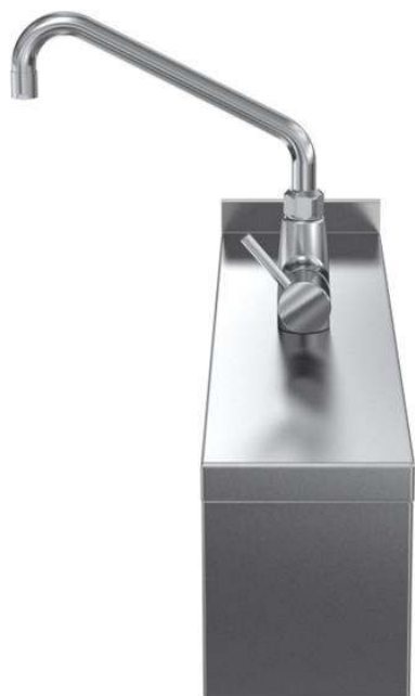
588710 (MBEABBB000) Colonnina acqua con leva, con alzatina posteriore - 1 lato operatore